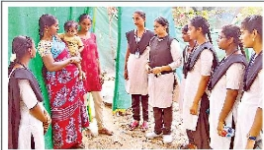
ఊలుపాలెంలో స్థానికులకు అవగాహన కల్పిస్తున్న విద్యార్థినులు

రేపల్లె ఏటీఆర్ ప్రభుత్వ డిగ్రీ కళాశాల ఎన్ఎస్ఎస్ విద్యార్థులు సేవాపథం పయనిస్తున్నారు. సమాజాభివృద్ధికి తమవంతు కృషి చేస్తున్నారు. ఈ నెల 25 నుంచి 31 వరకు ఉప్పుడి పంచాయతీ పరిధి లోని గ్రామాల్లో ప్రత్యేక సేవా శిబిరం నిర్వహించారు. ప్రభుత్వ పాఠశాలల, ఆంగ్లవాడీ కేంద్రాలు, కార్యాలయ ప్రాంగణాలు, రహదారుల పక్కన పిచ్చి మొక్కలు, వృద్ధులు తొలగించారు. కిరీ మంది విద్యార్థులు ఇసు బృందాలుగా ఏర్పడి ఉప్పుడి, ఊలుపాలెం గ్రామాల్లో ఇంటింటికీ వెళ్లి ఆక్షరాస్యత, పరిసరాల పరిశుభ్రత, ఆరోగ్యం, మౌగర్లు జలాల పరిరక్షణపై ఆచరణాత్మక కల్పనలు చేపట్టారు. పల్లెల్లోని వీధుల్లో ప్రదర్శనలు జరిపారు. తాగు నీటి, పారిశుధ్యం తదితర సమస్యలతో బిచ్చు