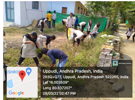
NSS Volunteers cleaning the surroundings of a Church in Uppudi village