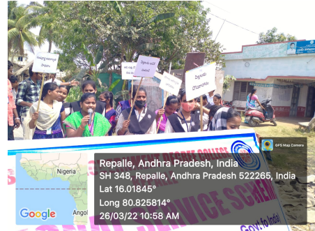
NSS Volunteers conducting rally in Uppudi village

This camp was inaugurated by village Sarpanch Smt.Vijaya, She addressed the volunteers and explained the social problems prevailed in the Village. In this camp 50 NSS volunteers are actively participated. During this Special camp volunteers conducted door to door campaign to create awareness among villagers about literacy, child marriages, health and hygiene, waste management etc., This special camp has been organized by NSS programme officer Sri. Shaik Sattar. The camp was closed on 31/03/2022 with the valedictory function.